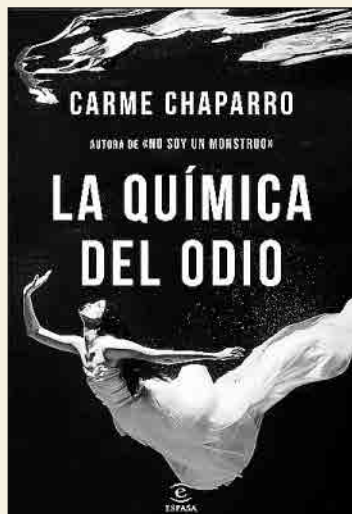
Carme Chaparro La química del odio ESPASA. Barcelona, 2018

❖ Esta novela llega tras el rotundo éxito de No soy un monstruo , con el que Carme Chaparro se convirtió en una de las autoras revelación de 2017. En ella la inspectora jefe Ana Arén, tras haber resuelto un caso que casi acabó con ella, se enfrenta a otro más difícil: el asesinato de una de las mujeres más famosas de España. Su jefe la cuestiona, su equipo no confía en ella, y encima tiene que soportar a los media.